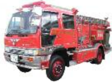
水そう付ポンプ自動車