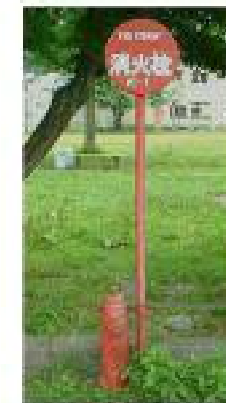
《 消火栓 》

119番にいたずら電話をすると、ほんとうに消防車や救急車が必要な人にとてもめいわくをかけます。ぜったいにやめましょう。