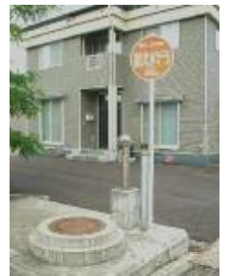
《 防火水そう 》

消火栓や防火水そうは、火事になったときに使う大事な水源です。いたずらは絶対にやめましょう。