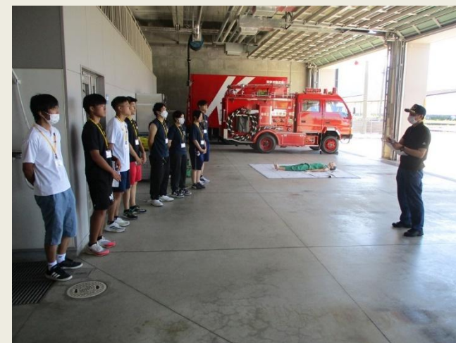
これまでの実施状況