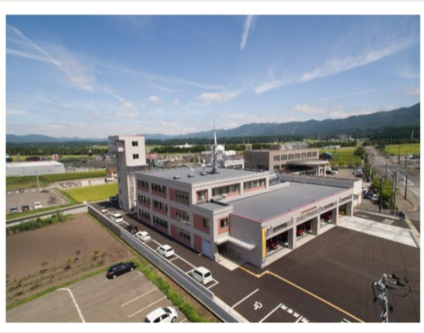
消防庁舎:ドローンでの撮影